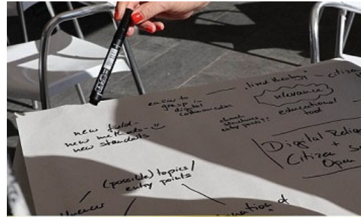
Digital Religion(s) Conference 16. bis 21. Oktober 2022, Congressi Stefano Franscini (CSF) - Monte Verità

Bei der interdisziplinären Tagung am 1./2. Dezember 2022 arbeiteten Nachwuchswissenschaftler*innen, App-Entwickler*innen, User*innen und Expert*innen an zentralen Fragen, die im Zusammenhang mit der Verwendung von Apps in religiösem Kontext stehen - hier im Video einige Impressionen. Organisiert wurde die Tagung von den UFSP-Projekten 6 und 9.