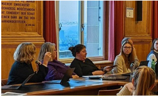
Die Alltagsbedeutung religiöser Apps erforschen Tagung am 1. und 2. Dezember 2022 Organisiert vom UFSP-Projekt 6

Wir blicken zurück auf ein ereignisreiches Jahr mit vielen Veranstaltungen, die sowohl vor Ort als auch digital stattfinden konnten. Hier eine Auswahl unserer Highlights.