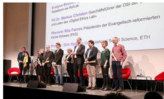
Digital Religion(s) goes public Kickoff-Event UFSP Digital Religion(s) 1. April 2022, Museum für Gestaltung

Am 19./20. Oktober 2022 fand eine Online-Tagung zu Fragen der Telechaplaincy im 21. Jahrhundert statt. Die Teilnehmenden tauschten sich über praxisnahe Erfahrungen im digitalen Raum und über neue digitale Möglichkeiten aus. Die Tagung wurde von