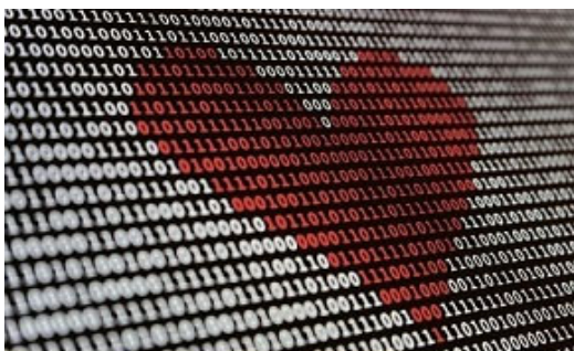
Spiritual Care for the 21st Century Konferenz am 19./20. Oktober 2022 Organisiert vom UFSP-Projekt 11

Bei der Digital Religion(s) - Konferenz vom 16. - 21. Oktober 2022 kamen der UFSP und internationale Expert*innen zusammen, um emerging topics , emerging methodologies und emerging projects der Digital-Religion(s)-Forschung zu diskutieren und die nächsten Schritte in der digitalen Theologie und Religionsforschung zu erkunden. Mehr dazu im Review auf unserer Webseite.