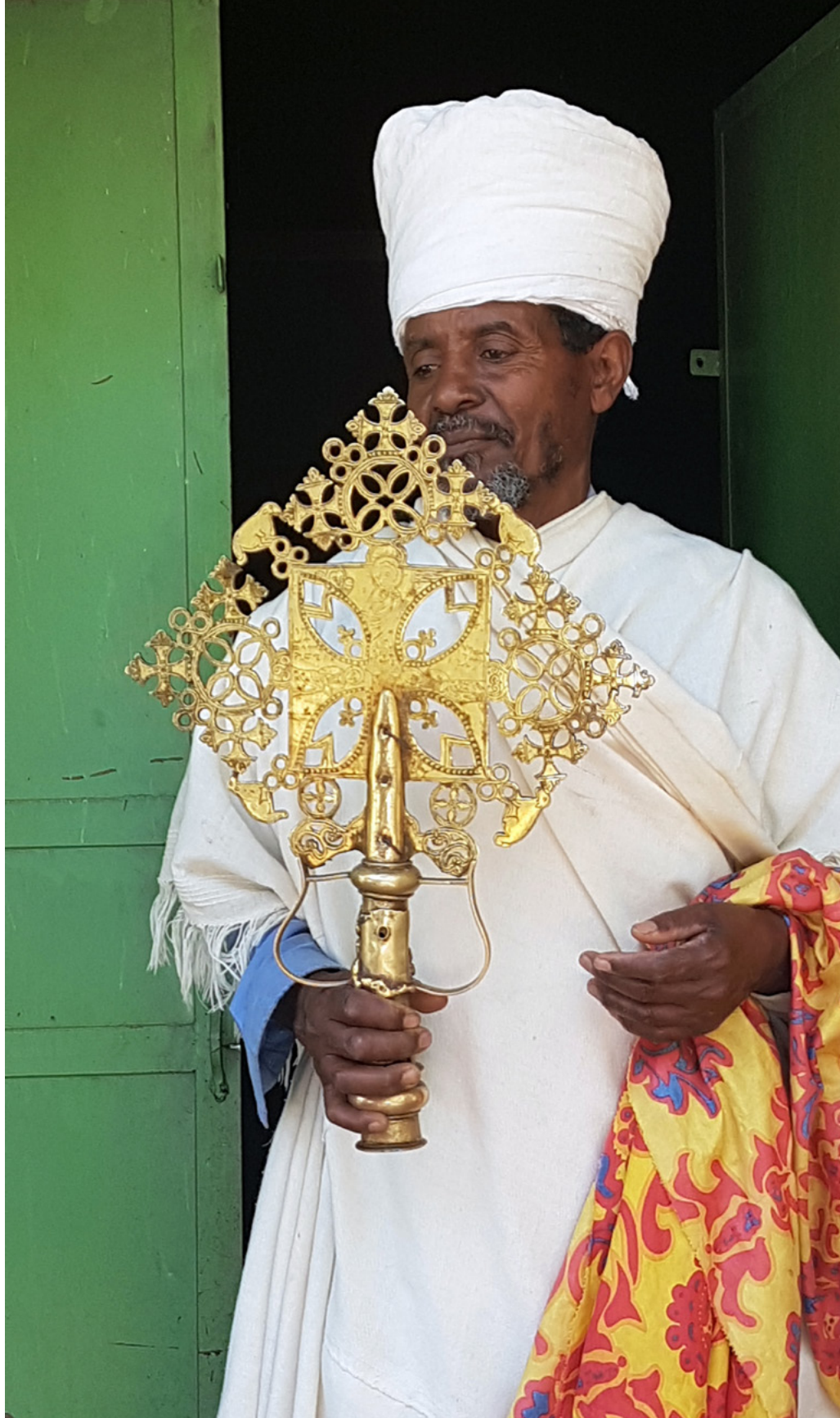
Äthiopisch-orthodoxer Geistlicher präsentiert ein verziertes Kreuz.

Gleichzeitig ist die Technologie für die grundlegende Digitalisierung von Manuskripten in den letzten Jahren fortwährend erschwinglicher geworden und bietet einem Land wie Äthiopien die Möglichkeit, sein eigenes Erbe digital zu bewahren und