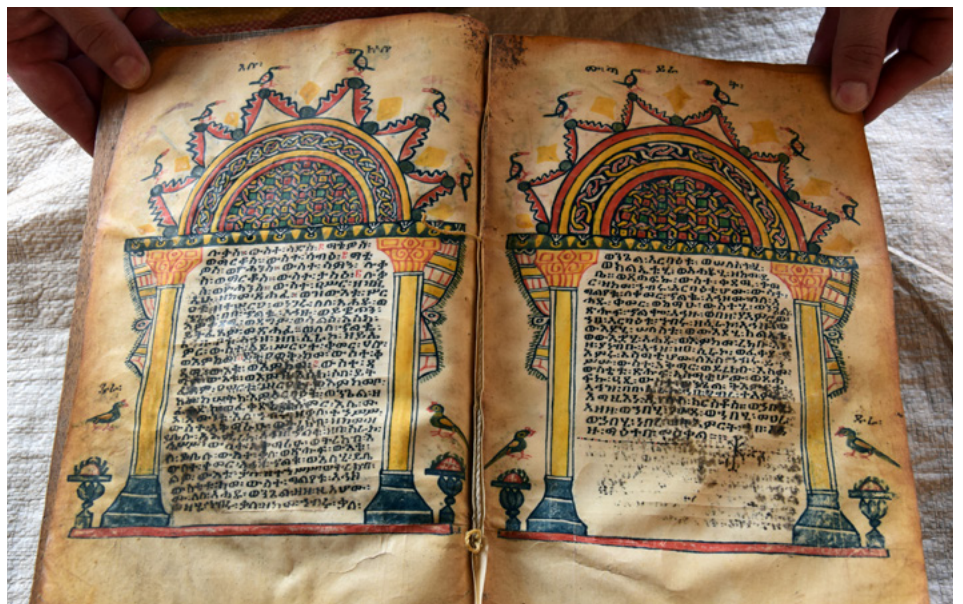
Äthiopische Übersetzung eines Textes des Eusebius von Caesarea.