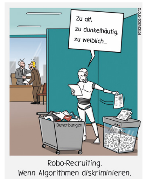
Weitere witzige Cartoons zu neuen Technologien und digitalen Trends auf www.cloud-science.de.