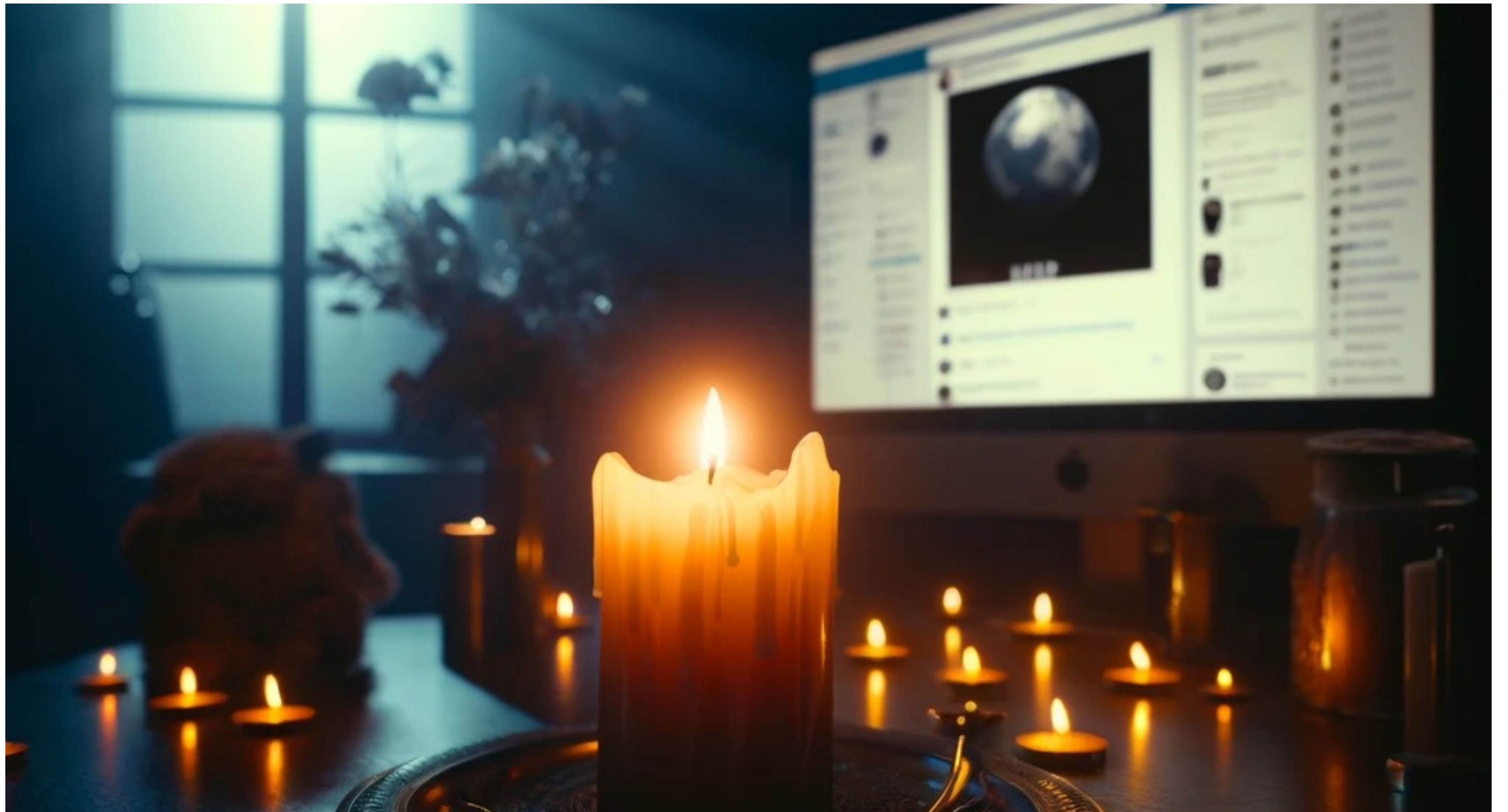
Fig.1: Shedding light on the digital dimensions of grief (DALL·E created).